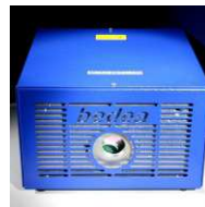
6 Stück #97000664 BLP CDM 150 W Lichtprojektor mit integr. 1-10V Schnittstelle, z.T. mit Dimmfunktion