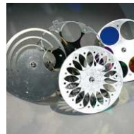
6 Stück #97000694 FED Farbscheibe MDL DFF 3 Stück #97000696 FED Dimmscheibe MDL