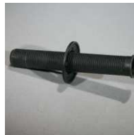
130 Stück #97000484 DKO Deckeneinbauhülse 10/14/90 PA