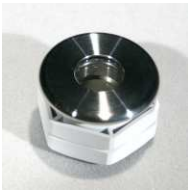
12 Stück #97000511 UWS FO-Strahler M25/35/20/V4A