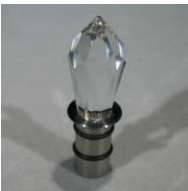
10 Stück #97000706 DKO Kristall 28/10/15 V2A