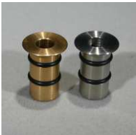
120 Stück #97000620 EBS Mini-Bundhülse 10 / 15 V2A