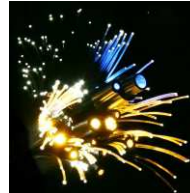
ca. 1300m #97000595 FOP PMMA Faserkabel 5.0 Y 6.8