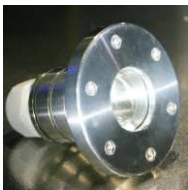
11 Stück #97000368 UWS Linsenstrahler 5xM6/63/110/V4A